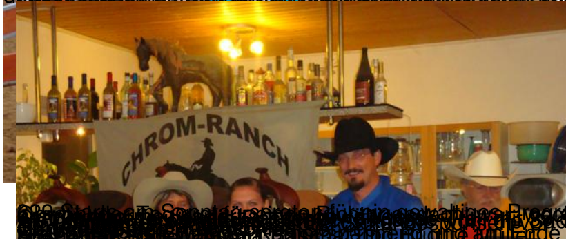
Am Sonntagabend fand ein weiteres Event statt, bei dem sich die Richterinnen ab, und die Teilnehmerinnen und Teilnehmer an einem tollen Spektakel und der schönen Rangierfreude beteiligen konnten.