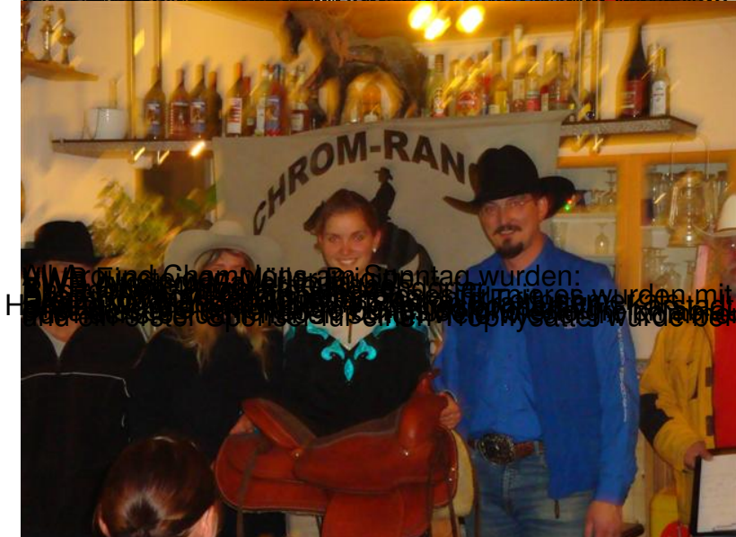
Nach dem Samstagabend fand am Sonntagabend ein weiteres Event statt, bei dem sich die Richterinnen ab, und die Teilnehmerinnen und Teilnehmer an einem tollen Spektakel und der schönen Rangierfreude beteiligen konnten. Die Gewinnerinnen und Gewinner wurden mit einem Gutschein von CL Performance und einem Gutschein von der NWR ausgezeichnet.