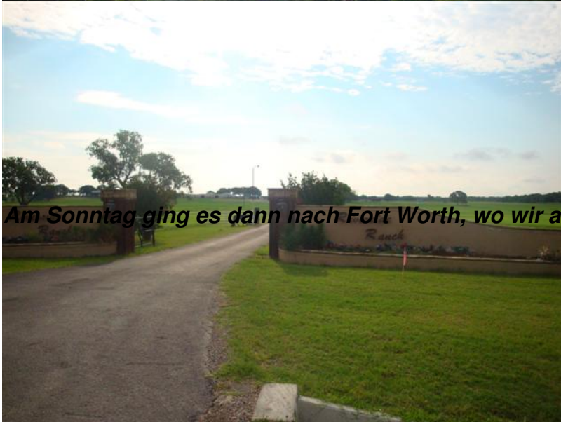
Am Sonntag ging es dann nach Fort Worth, wo wir auf alle anderen getroffen sind.