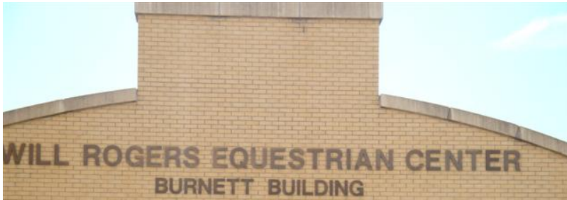
Endversuche aller Art im Rahmen der World Show und die Bronzemedaille zu erreichen.