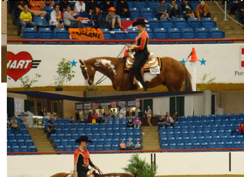
am Dienstag vorbestritten und dann die Jugendlichen die ihren langen Heimflug.