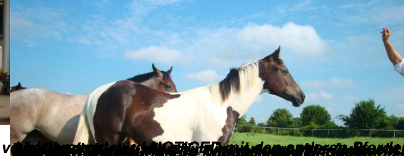
vorherhin und NOTIGED mit den anderen Pferden auf der Riverside Ranch aufgegriffen als ausgeglichene und